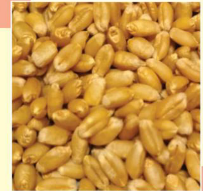
डीबीडब्लू 173 के दाने