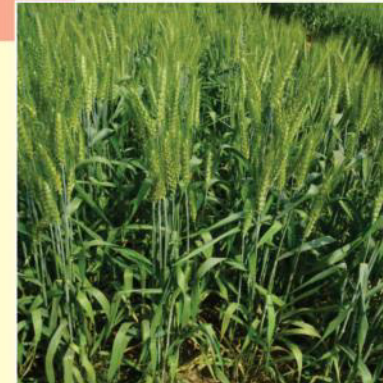
डीबीडब्लू 173 की फसल

इस किस्म से औसतन 18.9 क्विंटल/एकड़ उपज प्राप्त की जा सकती हैं।